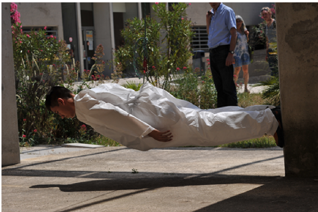
Lycée JEAN MONNET MONTPELLIER

Cette épreuve est plus difficile pour les candidats non-inscrits en enseignements facultatifs art-danse.